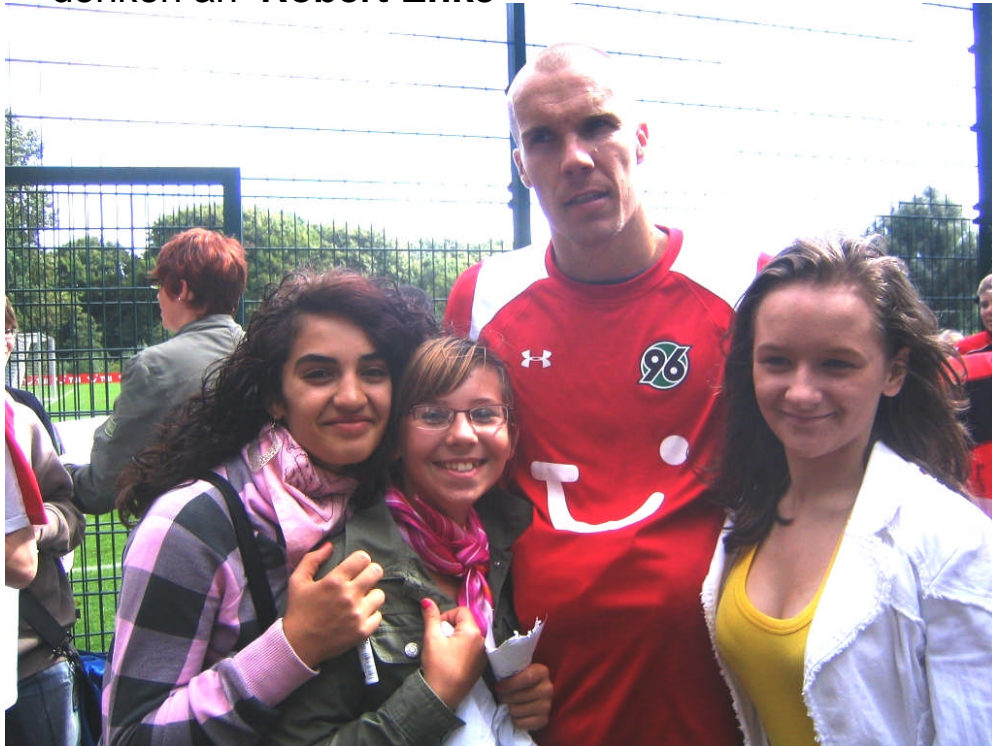
Robert Enke zu Besuch bei der „Sommer- schule“ der IGS Linden 2008