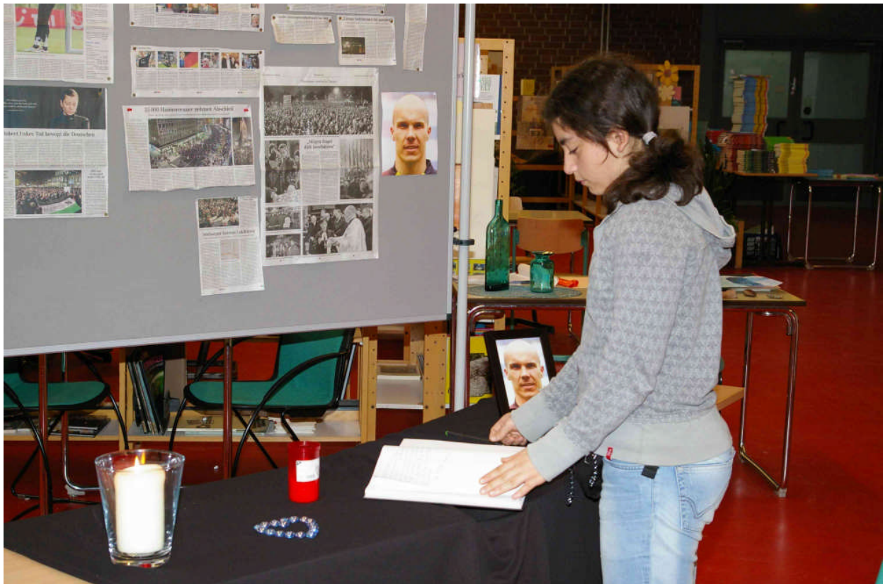
Kondolenzbuch und Erinnerungswand in der Bibliothek, November 2009