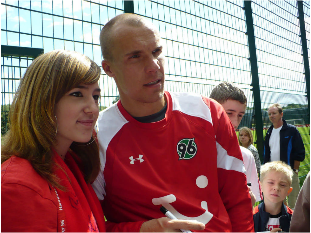
So behalten wir ihn in Erinnerung (Sommerschule 2008)