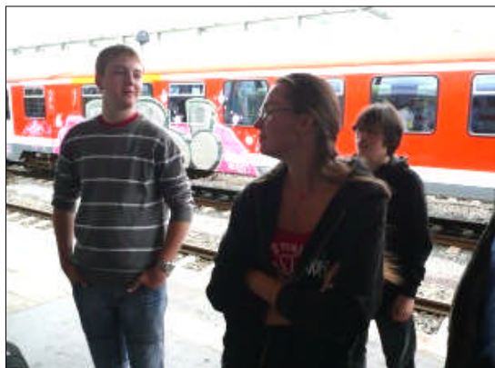
Verabschiedung Hbf Hannover