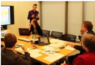
Ein souveräner Auftritt vor der Wirtschaftsjury in Frankfurt

Die Lehrkräfte trainieren während des gesamten Kurses Pünktlichkeit, Höflichkeit und gutes Auftreten mit den Schülern.