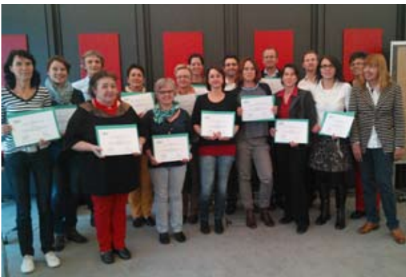
Erfolgreich zertifiziert: Neue NFTE Lehrkräfte aus Baden- Württemberg im Oktober 2014

Am Ende des Kurses erhalten sie ein Zertifikat als Certified Entrepreneurship Teacher (CET). Dieses berechtigt sie zum Unterricht mit dem NFTE Curriculum . Als CETs tragen sie die Förderung von Persönlichkeitsentwicklung und Unternehmergeist in ihre Schulen hinein. Dabei steht das NFTE Team beratend zur Seite und unterstützt den Austausch der NFTE Lehrkräfte untereinander. Dieses Netzwerk der hoch engagierten Entrepreneurship Lehrkräfte macht den nachhaltigen pädagogischen Erfolg möglich.