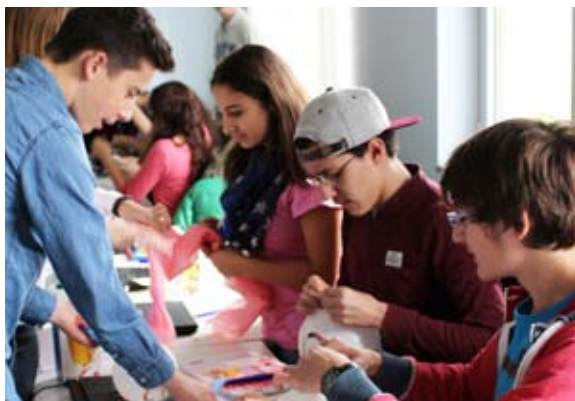
Schülergruppe beim Erfindungsspiel: Phantasievoll bei der Arbeit!

Fast spielerisch werden durch integrierte Übungen auch Defizite in Deutsch und Mathematik aufgearbeitet. Durch den fächerübergreifenden, interaktiven Lehrplan verbessern die Mädchen und Jungen ihre Ausdrucks-, Präsentations- und Rechenfähigkeiten ebenso wie ihre Kenntnisse in IT.